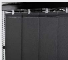
Skena, reglageliner och beslag i svart utförande.